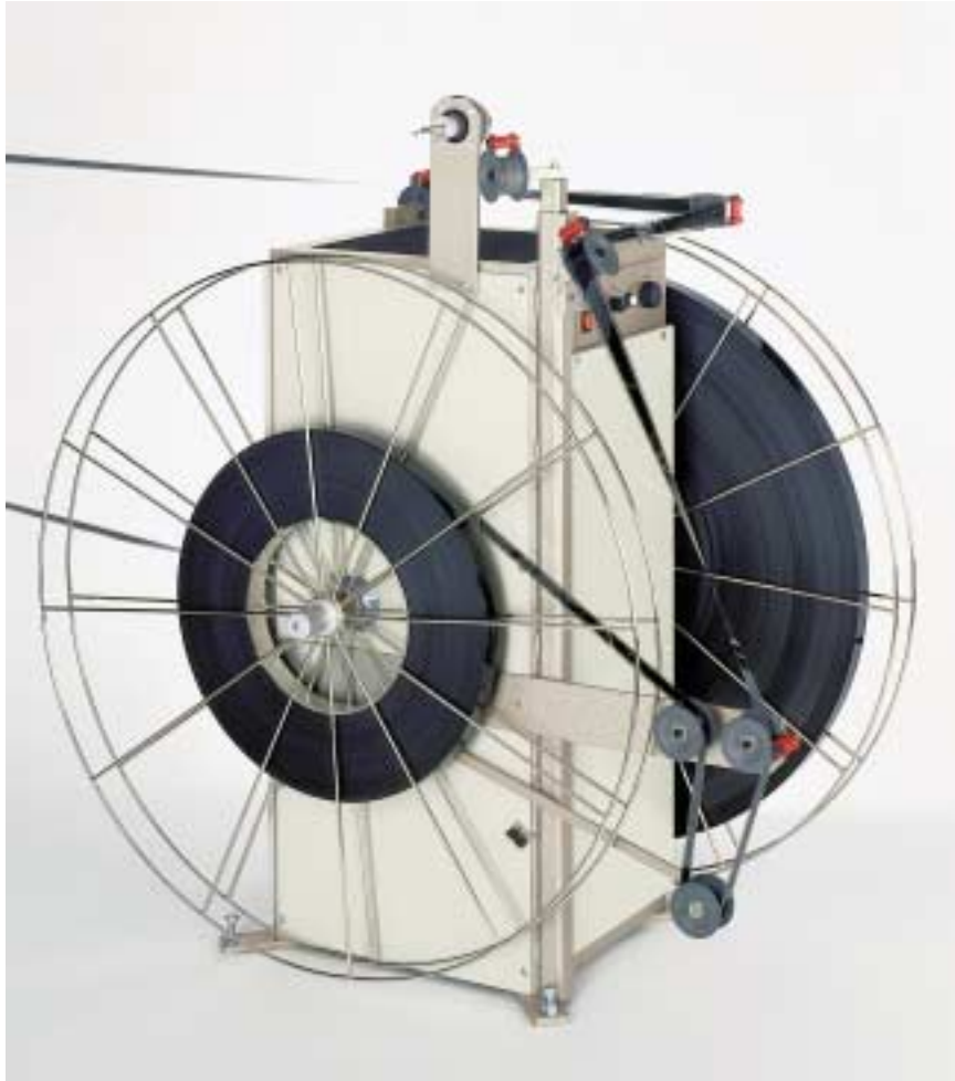
Version SPT 5000 K siehe separate Produktinformation