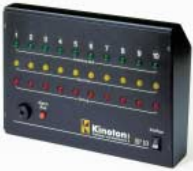
Statusanzeige SP 10