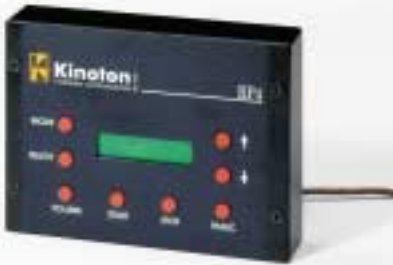
Fernsteuerung RP 4